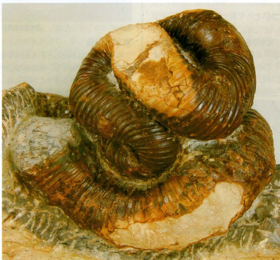
ニッポニテス・ミラピリス（北海道化石会所蔵）